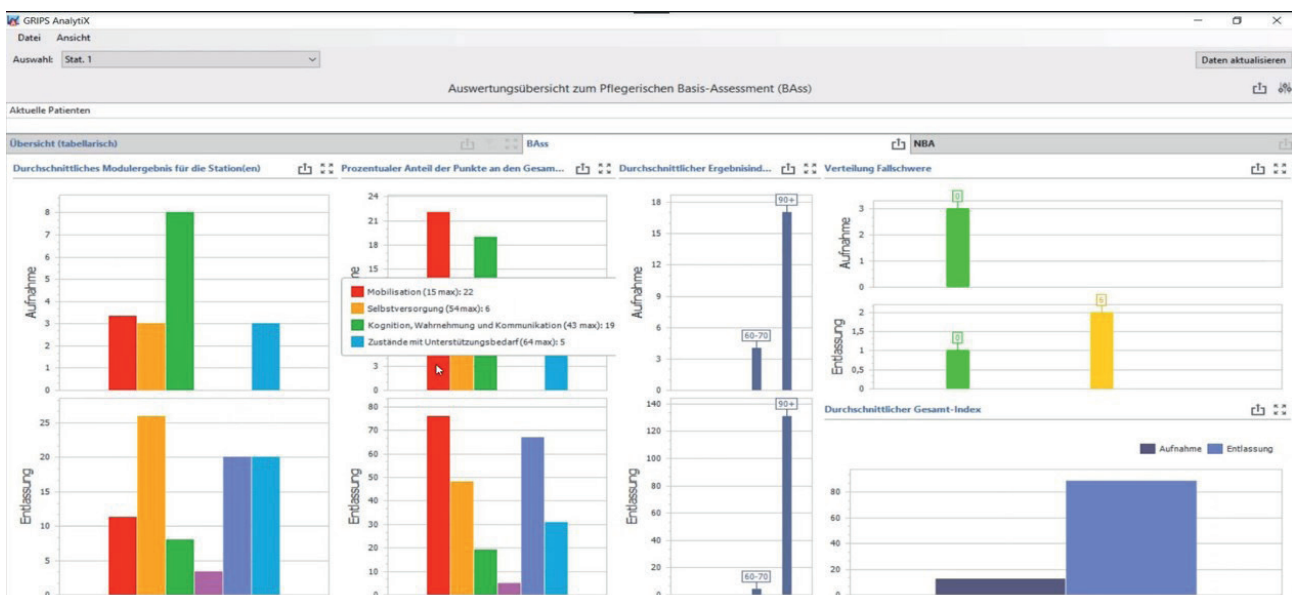
AnalytiX – Ihr Auswertungstool in RECOM-GRIPS (beispielhafte Darstellung).